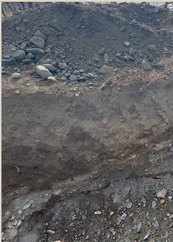
PIEDRA Y GRAVA