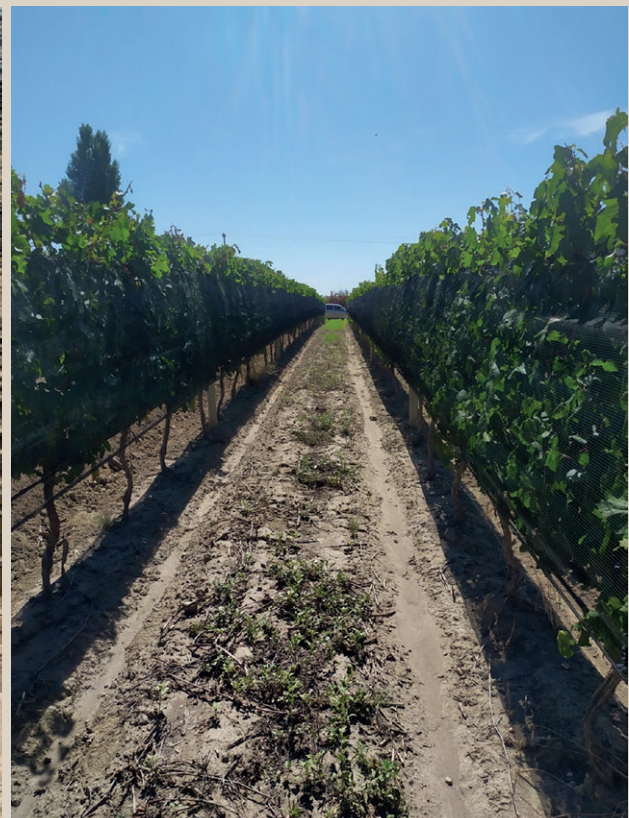
SUELO CON MENOR VIGOR